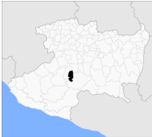
Región X. Infiernillo.